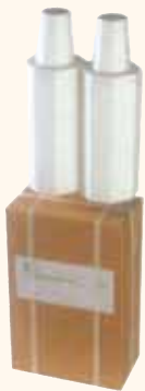
SPEDIZIONE VIA AEREA da 2 bottiglie 26x14x39 cm