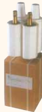
SPEDIZIONE VIA AEREA da 4 bottiglie 26x26x39 cm