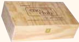
COFANETTO IN LEGNO da 2 bottiglie 23x37x10 cm