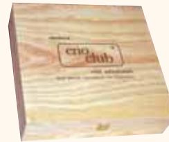
COFANETTO IN LEGNO da 4 bottiglie 38x37x10 cm