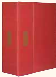
COFANETTO da 3 bottiglie 29x35x11 cm