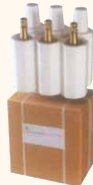
SPEDIZIONE VIA AEREA da 6 bottiglie 36x26x39 cm