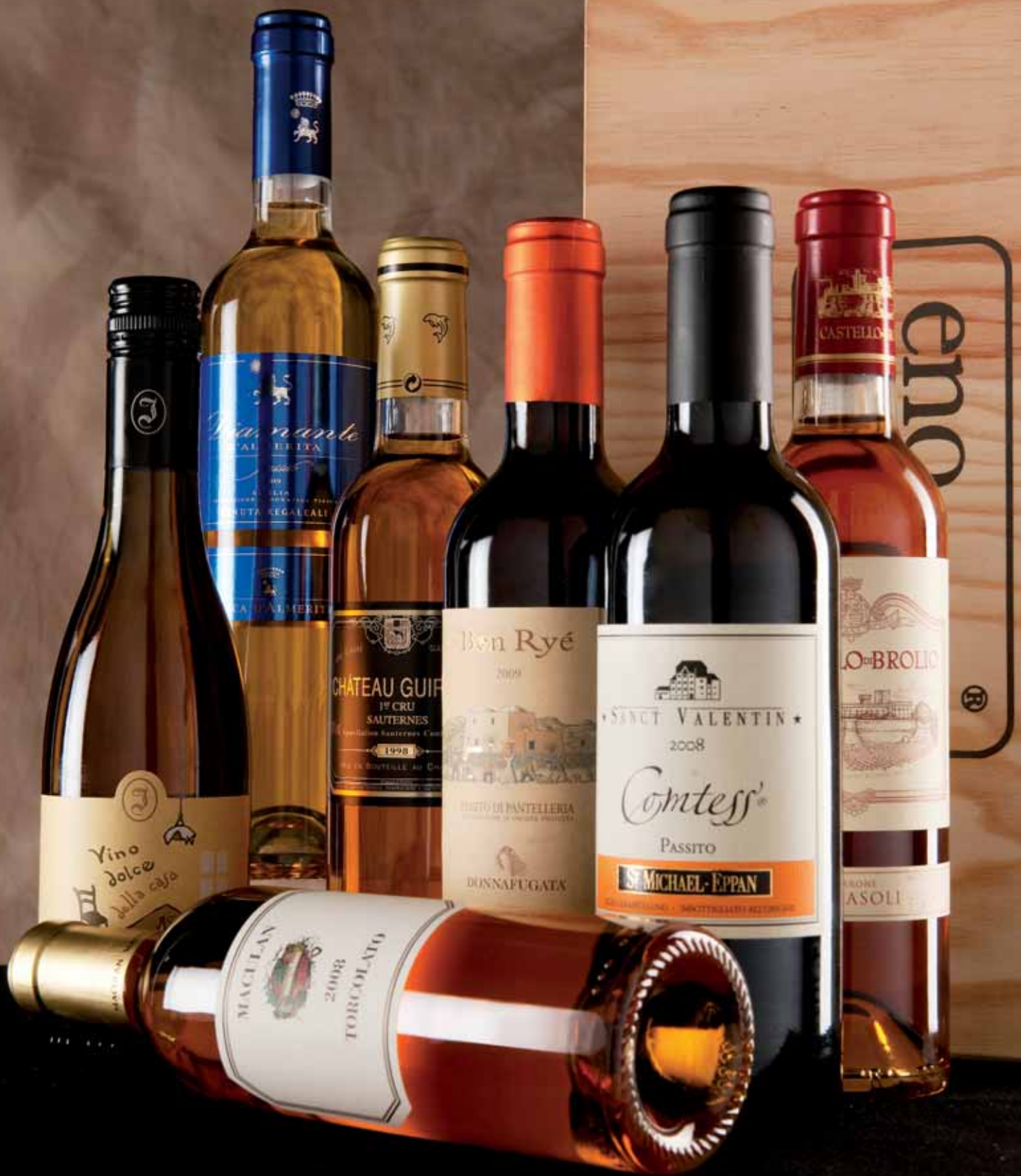
Vini da Dessert / Sauternes