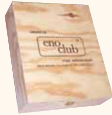
COFANETTO IN LEGNO da 3 bottiglie 30x37x10 cm