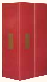
COFANETTO da 2 bottiglie 21x35x11 cm