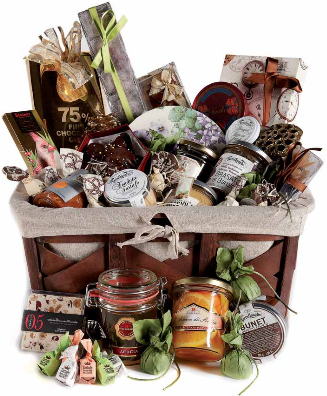
Cesti con Specialità Agroalimentari