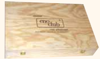
COFANETTO IN LEGNO da 6 bottiglie 53x35x10 cm