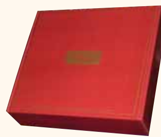
COFANETTO da 4 bottiglie 37x35x11 cm