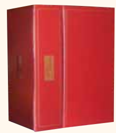
COFANETTO da 6 bottiglie 30x37x21 cm