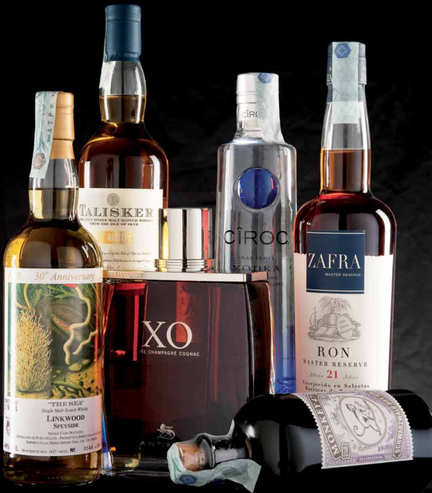
Distillati / Whiskies