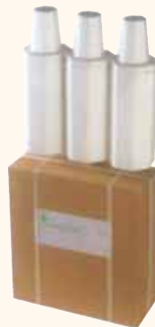
SPEDIZIONE VIA AEREA da 3 bottiglie 36x14x39 cm